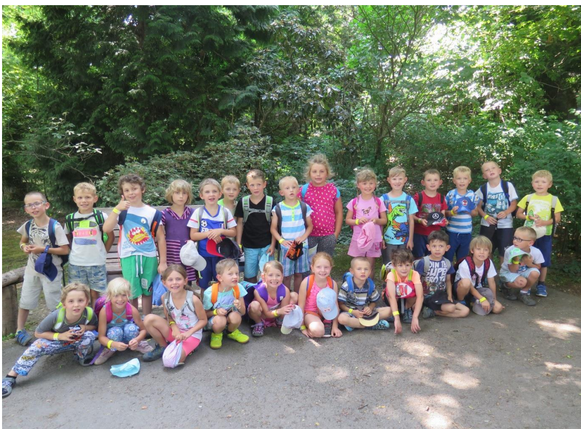
výlet MŠ do ZOO Praha

V rámci akcí mateřské školy jsme se snažili o aktivní zapojení do společenského života obce Hovorčovice. Realizovali jsme průvody celé mateřské školy v rámci tradičních svátků či akcí (Tři Králové, Masopust,...). Dále děti z mateřské školy pod vedením paní učitelek vystupovaly na kulturních akcích obce (Vánoční trhy, Vánoční setkání se seniory, Rozsvěcení vánočního stromu, Vystoupení v kostele obce, apod.).