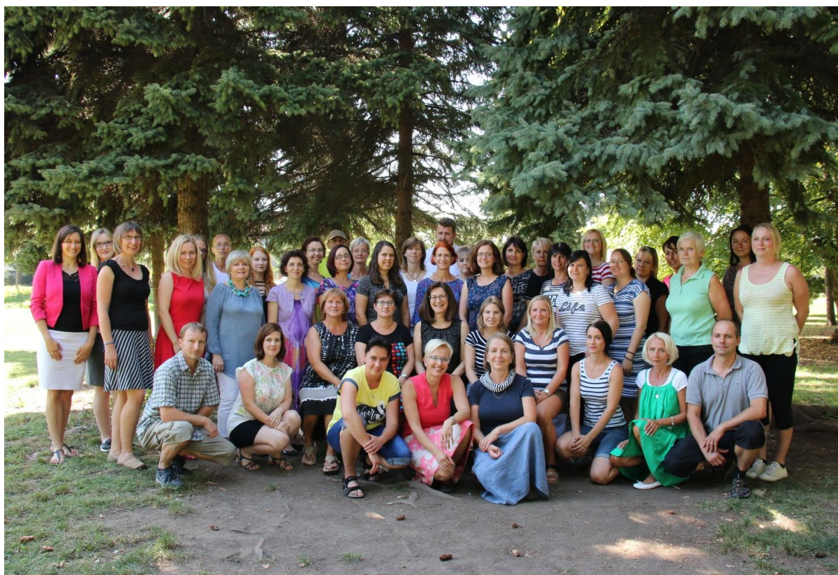
zaměstnanci ZŠ a MŠ Hovorčovice 2017/2018

Komentář: Ekonomka (provozní zaměstnanec) je zároveň zaměstnancem ZŠ i MŠ.