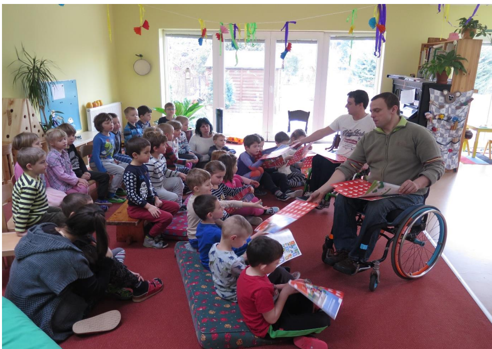
akce v MŠ: „VZPoua úrazům“ (tato akce proběhla i v ZŠ)