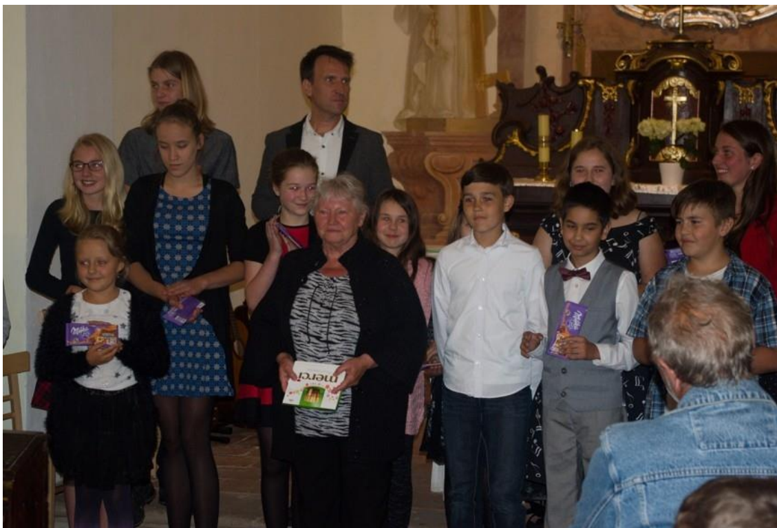
činnost Umělecké akademie – Koncert u příležitosti Noci kostelů (květen 2018)