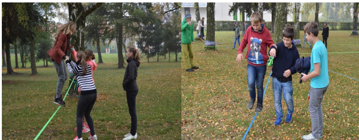
„Slackline park“ – pro rozvoj pohybových schopností našich žáků