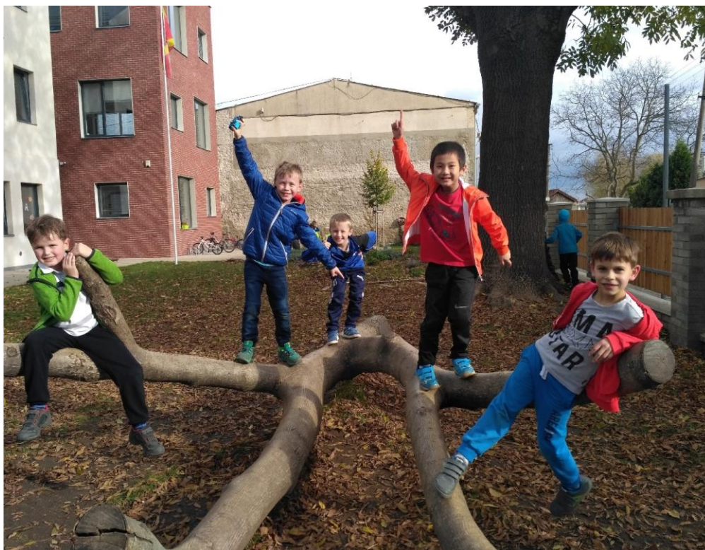
družina při pobytu venku

V tomto školním roce jsme otevřeli celkem 5 oddělení družiny, o která se staralo celkem 5 vychovatelů.