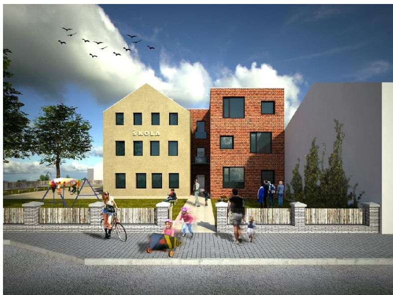
budova 1. stupně ZŠ – otevřena v září 2015