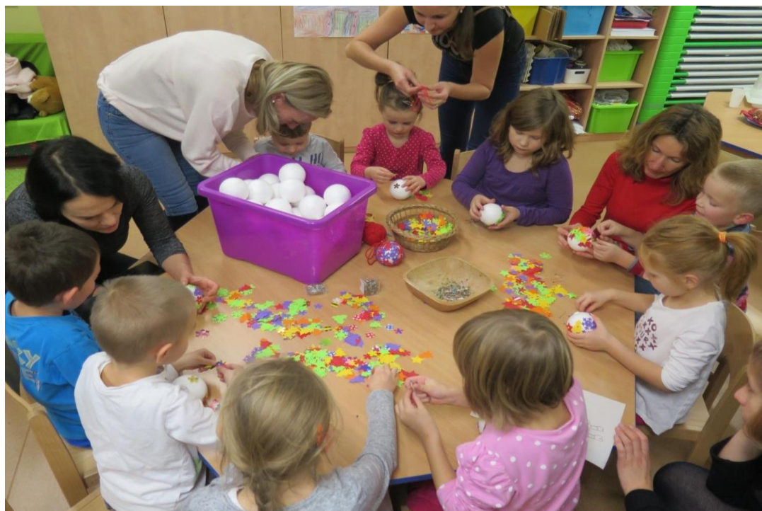
společné adventní dílny s rodiči