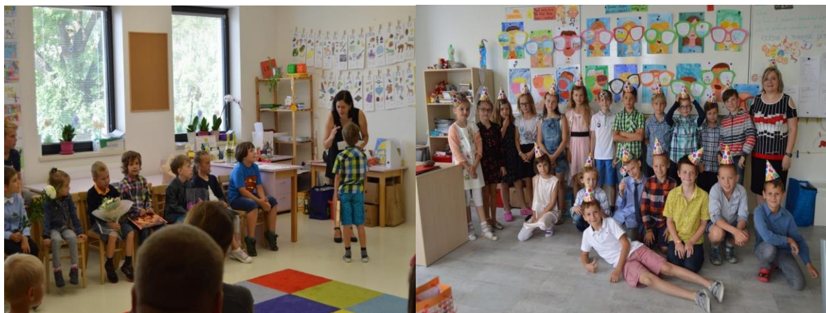
a nakonec...předávání vysvědčení, kdy se už každý těší na prázdniny...